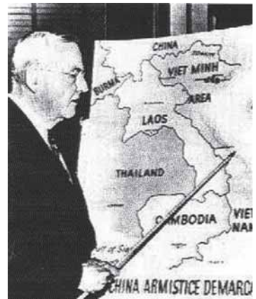
จอห์น ฟอสเตอร์ ดัลเลส

ภาวะตึงเครียดระหว่างชาติ เกิดขึ้นในปลายเดือนมีนาคม ค.ศ. 1945 ขณะที่จอห์น ฟอสเตอร์ ดัลเลส รัฐมนตรีต่างประเทศของอเมริกาเรียกร้องให้มีปฏิบัติการร่วมกันเกี่ยวกับปัญหาเดียนเบียนฟูที่เพลาลงไปเพียงบางส่วนเมื่อที่ประชุมในกรุงเจนีวาประสบความสำเร็จให้มีการหยุดยิงในเวียดนาม ดัลเลส และเซอร์แอนโทนี อีเดน รัฐมนตรีต่างประเทศอังกฤษ แลกเปลี่ยนความร่วมมือกัน เมื่อวันที่ 13 เมษายน ประกาศว่ารัฐบาลของทั้ง 2 ประเทศพร้อมตรวจสอบร่วมกับประเทศอื่นๆ ที่เกี่ยวข้อง เพื่อหาทางจัดตั้งระบบป้องกันร่วมกัน “เพื่อเป็นหลักประกันสันติภาพ ความปลอดภัยและเสรีภาพของภูมิภาคเอเชียตะวันออกเฉียงใต้ และแปซิฟิกตะวันตก” วันต่อมาดัลเลสและบีโดท์ รัฐมนตรีต่างประเทศฝรั่งเศส ก็ออกประกาศที่คล้ายคลึงกันอีกฉบับหนึ่ง เป็นการเริ่มการเจรจาทางการทูต ซึ่งนำไปสู่การลงนามในสนธิสัญญาป้องกันร่วมกันในภูมิภาคเอเชียตะวันออกเฉียงใต้ ณ กรุงมะนิลา ในวันที่ 8 กันยายน ค.ศ. 1954 ชาติที่ร่วมลงนามมีสหรัฐอเมริกา อังกฤษ ฝรั่งเศส ออสเตรเลีย นิวซีแลนด์ ปากีสถาน ไทยและฟิลิปปินส์ และเพื่อให้เป็นไปตามจุดประสงค์ จึงร่วมกันจัดตั้ง องค์การสนธิสัญญาเอเชียตะวันออกเฉียงใต้ (SEATO) เพื่อปฏิบัติการทั่วไปที่จะต้องคุ้มครองสันติสุข เพื่อความร่วมมือทางเศรษฐกิจและพัฒนการด้านสมรรถนะของประเทศสมาชิก ที่จะต่อต้านการคุกคามด้วยกำลังทหาร และการบ่อนทำลายที่บงการจากภายนอกประเทศ