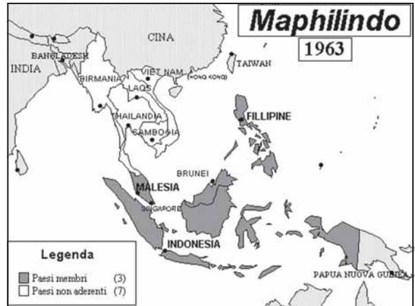
แผน “มาฟิลินโด” ของอินโดนีเซียในการสถาปนารัฐใหม่รวมมาเลเซีย อินโดนีเซีย และฟิลิปปินส์ ค.ศ. 1963 เพื่อสกัดกั้นการสถาปนามลายูและดินแดนอาณานิคมของอังกฤษให้เป็นประเทศ “มาเลเซีย”

ความล้มเหลวในการที่จะเกลี้ยกล่อมซูการ์โนให้ระงับนโยบาย “บดขยี้มาเลเซีย” ของเขาได้ ในเดือนสิงหาคม ค.ศ. 1963 มีการประชุมขึ้นอีกครั้งที่กรุงมะนิลาระหว่างซูการ์โนและมาคาปากัล ได้ตกลงกันว่าให้เชิญคณะผู้แทนจากสหประชาชาติเข้าไปสำรวจความต้องการของชาวบอร์เนียวเกี่ยวกับเรื่องมาเลเซีย และให้ยืดเวลาการประกาศตั้งมาเลเซียออกไปจนกว่าคณะผู้แทนนั้นจะทำงานสำเร็จ และยังได้ตกลงกันเกี่ยวกับความปรารถนาที่จะจัดตั้งสมาคม ซึ่งจะรวมมลายู ฟิลิปปินส์และอินโดนีเซียเข้าด้วยกันเรียกว่า มาฟิลินโด ด้วยเหตุนี้ในเดือนสิงหาคม ค.ศ. 1963 คณะผู้แทนของสหประชาชาติ พร้อมด้วยกลุ่มคณะผู้สังเกตการณ์ชาวฟิลิปปินส์ อินโดนีเซีย และมลายู จึงได้ตระเวนไปในดินแดนต่างๆ ของบอร์เนียวเพื่อตรวจสอบความถูกต้องของการออกเสียงเลือกตั้งในบอร์เนียวเหนือในเดือนธันวาคม ค.ศ. 1962 และในซาราวักเมื่อเดือนมิถุนายน ค.ศ. 1963 ผลก็คือ ทั้ง 2 แห่งนั้นผู้สมัครที่สนับสนุนมาเลเซียได้ชัยชนะจากเสียงส่วนใหญ่