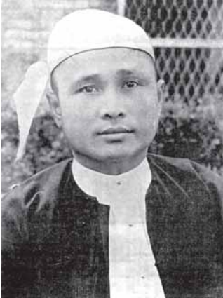
ตะซิ่นนุ หรืออูนู เป็นนายกรัฐมนตรีพม่าเมื่อได้รับเอกราชเมื่อวันที่ 4 มกราคม ค.ศ. 1948

ศูนย์บัญชาการก๊กมินตั๋งในต้น ค.ศ. 1954 จากนั้นก็สั่งให้ทหารจีนถอนออกจากพม่า แต่ทหารนับพันของนายพลหลี่มีทลเปลี่ยนคำสั่งนั้น และหว่างปีนั้นก็มีการลอบยิงจากใต้หวันหลังไหลเข้าพม่า ในเดือนเมษายนและพฤษภาคม ค.ศ. 1955 พม่าปฏิบัติการทางทหารครั้งใหญ่เพื่อต่อต้านทหารจีน แต่กระนั้นทหารจีนจำนวนมากก็ยังปฏิบัติการอย่างกว้างขวางภายใต้การกำกับจากศูนย์ ตามพรมแดนซึ่งยังคงล้อมรอบค้ำฝั้น เอาเงินปลอมมาใช้หมุนเวียน และเก็บภาษีโดยการชุกกรโศกตามหมู่บ้านแถบเชิงเขา