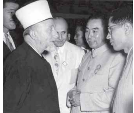
การประชุมชาติแอฟริกา-เอเชีย หรือกลุ่มประเทศเป็นกลาง ณ เมืองบันดุง อินโดนีเซีย จีนส่งนายกรัฐมนตรีโจวเอินไหลไปเป็นตัวแทน และประสบผลสำเร็จในการรุกทางการทูต

น้ำใจไมตรีปรากฏขึ้นเด่นชัด โดยเฉพาะที่ท่าเป็นมิตรของนายกรัฐมนตรีโจวเอินไหล ที่สำคัญคือการลงนามในข้อตกลงทั่วไปกับอินโดนีเซีย เกี่ยวกับฐานะความเป็นพลเมืองของชาวจีนในพื้นที่ทะเลและการรับประกันอย่างสุภาพกับรัฐบาลของประเทศเอเชียตะวันออกเฉียงใต้ รัฐบาลเหล่านั้นไม่มีเหตุให้ต้องตกใจในเรื่องความมุ่งหมายของจีนต่อประเทศเหล่านั้น ท่าทีของโจวเอินไหลลดความตึงเครียดลงไปได้อย่างเห็นชัด ผู้แทนจำนวนมากแสดงออกถึงความกลัว “ลัทธิอาณานิคม” มากกว่าลัทธิคอมมิวนิสต์ ด้วยเหตุนี้คำว่า “นโยบายบันดุง” และ “จิตใจแห่งบันดุง” จึงนำมาใช้ในความหมายของการไม่รุกรานและการแก้ปัญหาอย่างสันติระหว่างชาติสมาชิก แม้แต่เห็นรักรู้คิดว่หลังการประชุมบันดุงแล้ว ตนคงรู้สึกกระอักกระอ่วนใจถ้าหากบังกึ่งเหยียบย่ำหลักการทั้ง 5 แน่นนอนที่จีนกำลังเดินหมากให้กำลังใจแก่พวกที่มีความคิดเป็นกลาง ทำให้อิทธิพลพวกนิยมตะวันตกอ่อนลง และเพื่อความสนับสนุนในสหประชาชาติ ตลอดจนส่งเสริมการจัดตั้งรัฐบาลชนิดที่ปูทางไว้ให้คอมมิวนิสต์เข้ายึดครอง ยิ่งกว่านั้นโจวเอินไหลยังแสดงความประหลาดใจที่เห็นบรรดาผู้แทนในที่ประชุมบันดุงมีความกลัวจีนอย่างมาก