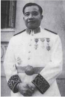
เจ้าสุวรรณหงษ์

อย่างไรก็ตามข้อตกลงนั้นซับซ้อน และการทำตามข้อตกลงก็เป็นไปอย่างเชื่องช้า เพราะมีการคัดค้านและหาถ่วงระแวงกัน ความจริงอีกอย่างก็คือลาวกลายเป็นสนามรบอย่างจำใจของกำลังทัพที่อยู่ นอกเหนือการควบคุมของประเทศลาว ฝ่ายหนึ่งคือจีนคอมมิวนิสต์และเวียดนามเหนือ อีกฝ่ายหนึ่งเป็นประเทศต่อต้านคอมมิวนิสต์คือประเทศไทย ซึ่งมีศูนย์กลางองค์การซีดีไอในกรุงเทพฯ ยิ่งกว่านั้นทั้งๆ ที่ข้อตกลงเงินว่าได้ว่าฐานะเป็นกลางไว้ให้แก่ลาว นโยบายของอเมริกาก็กำลังหาทางทำให้ลาวเป็นกำแพงต่อต้านคอมมิวนิสต์ ความช่วยเหลือของอเมริกาที่ให้แก่ลาวคิดเป็นอัตราส่วนต่อคนตามจำนวนประชากรสูงกว่าที่ให้แก่ประเทศใดในโลก โดย 4 ใน 5 ของความช่วยเหลือนั้นให้แก่กองทัพและการตำรวจ