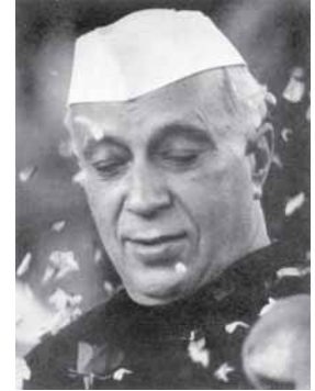
เนห์รู ประธานาธิบดีคนแรกของอินเดีย

ท่าทีของประเทศอื่นๆ ในเอเชียตะวันออกเฉียงใต้ที่ไม่เข้าร่วมในองค์การคือ อินเดีย พม่าและอินโดนีเซียต่างคัดค้านอย่างรุนแรงต่อแผนการนี้ ลังกาปฏิเสธไม่เข้าร่วมประชุมที่กรุงมะนิลา แต่ก็ได้ประกาศความตั้งใจไม่ปฏิเสธความคิดใหม่ๆ เกี่ยวกับเรื่องนี้ ยิ่งกว่านั้นในขณะที่สหรัฐอเมริกา อังกฤษและฝรั่งเศสเริ่มดำเนินการตามแนวทางดังกล่าว นายกรัฐมนตรีของพม่า ลังกา อินเดีย อินโดนีเซียและปากีสถานก็ไปประชุมกันที่โคลัมโบเพื่ออภิปรายเกี่ยวกับสถานการณ์ในระหว่างกลุ่มประเทศที่เรียกตนเองว่า “มหาอำนาจโคลัมโบ” ปากีสถานเท่านั้นที่เป็นสมาชิกขององค์การซีโต้ ส่วนประเทศอื่นต่างเชื่อว่าสนธิสัญญาทางทหารกลับจะยิ่งเพิ่มอันตรายแก่เอเชียตะวันออกเฉียงใต้ โดยเชื่อว่าหลักประกันสันติภาพที่ดีที่สุดคือการดำเนินตามนโยบาย “หลักแห่งความเป็นกลาง” ของเนห์รู ซึ่งนิยามไว้ใน “หลักปรัชญาศีลของการอยู่ร่วมกัน” อันมีชื่อเสียง ที่ทั้งอินเดียและจีนต่างตกลงร่วมกันเมื่อวันที่ 29 เมษายน ค.ศ. 1954 ดังต่อไปนี้