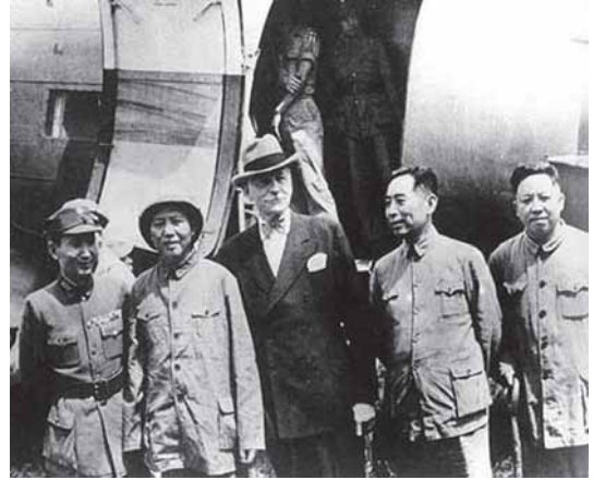
เหมาเจ๋อตุงและโจวเอินไหล ผู้นำพรรคคอมมิวนิสต์จีน พร้อมด้วยทูตสหรัฐ แพทริก เฮอร์ลีย์ ที่สนามบินเยหนาน วันที่ 28 สิงหาคม ค.ศ.1945 เดินทางไปยังกรุงปักกิ่ง เพื่อเจรจากับจีนคณะชาติของนายพลเจียงไคเช็ค

ชาวเอเชียตะวันออกเฉียงใต้กลัวประเทศจีนเนื่องจากสาเหตุ 3 ประการคือ (1) การอ้างสิทธิดั้งเดิมที่จะอยู่ในฐานะที่เหนือกว่าและเรียกร้องสิทธิตรงพรมแดนเมื่อไม่นานมานี้ (2) ลัทธิคอมมิวนิสต์และ (3) ที่ทำของชาวจีนประมาณ 10 ล้านคนที่อาศัยอยู่ในประเทศเอเชียตะวันออกเฉียงใต้ที่ผู้ว่าจะประกาศเอกราช เห็นได้จากสมัยต้นๆ ที่ผู้ปกครองในแถบเอเชียตะวันออกเฉียงใต้ส่งทูตไปยังกรุงปักกิ่งเพื่อให้จักรพรรดิจีนรับรอง ประวัติศาสตร์จีนได้รวบรวมว่าเป็นความสัมพันธ์ระหว่างเจ้านายกับบริวาร ทั้งที่ผู้ปกครองในเอเชียตะวันออกเฉียงใต้ไม่ได้คิดเช่นนั้น แต่ต้องการเสริมสร้างการค้ากับจีนที่ให้ผลกำไรงาม การดำรงตนในฐานะที่เหนือกว่าของจีนในยุคใหม่แท้จริงแล้วเป็นความเชื่อผิดๆ ที่จีนในสมัยราชวงศ์ชิงปลูกฝังไว้พร้อมกับความภาคภูมิใจอย่างล้นเหลือในวัฒนธรรมของตน เพื่อตอบโต้ต่อการเปลี่ยนแปลงที่เกิดจากอิทธิพลตะวันตก ความคิดลักษณะนี้อาจจะมีอิทธิพลต่อทัศนคติของผู้นำก๊กมินตั๋งในระยะแรก แต่เท่าที่ผ่านมาจีนคอมมิวนิสต์ดูจะไม่สนใจความคิดเช่นนั้นนัก ตรงกันข้ามความผูกพันทางประวัติศาสตร์ของจีนคือการรักษาความปลอดภัยตามพรมแดนและควบคุมสถานการณ์ในดินแดนถัดไปให้มั่นคง ดังนั้นสิ่งที่เอเชียตะวันออกเฉียงใต้หวาดกลัวคือจีนอาจเข้าแทรกแซงทางทหาร ครั้งหนึ่งมีเหตุแสดงว่าจีนคิดจะกดดันด้วยการเรียกร้องอย่างบ้าคลั่งแบบพวกก๊กมินตั๋งที่ต้องการสิทธิในดินแดนติดกับยูนนาน 1 แต่ความจริงแล้วจีนเพียงต้องการทำข้อตกลงทางชายแดนพม่า