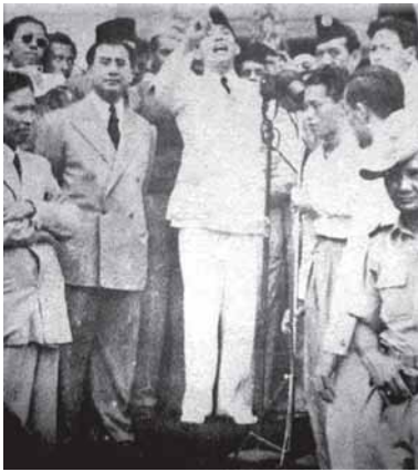
ประธานาธิบดีซูการ์โนขณะกล่าวสุนทรพจน์ ค.ศ. 1949 ซูการ์โนเป็นนักพูดที่ทรงพลังที่สุดคนหนึ่งของอุษาคเนย์

อินโดนีเซียเริ่มเป็นเอกราชด้วยการที่อำนาจตกอยู่ในมือผู้นำสาธารณรัฐที่ตั้งขึ้นใน ค.ศ. 1945 ขณะที่ญี่ปุ่นแพ้สงคราม ภายใต้ข้อกำหนดของรัฐธรรมนูญที่มีขึ้นขณะนั้น กำหนดให้มีสภาที่ปรึกษา มีตำแหน่งประธานาธิบดีและมีสภาผู้แทนราษฎรที่สมาชิกสภาได้รับการเลือกตั้ง แต่เนื่องจากการจะจัดให้มีการเลือกตั้งนั้นเป็นไปได้ยาก คณะกรรมการเตรียมการเพื่อเอกราชจึงตั้งข้อกำหนดไว้ว่า ประธานาธิบดีจะเป็นผู้ใช้อำนาจทั้งหมด โดยความช่วยเหลือของคณะกรรมการกลางแห่งชาติ ซึ่งประกอบด้วยสมาชิกที่ได้รับแต่งตั้งจำนวน 135 คน เรียกกันว่า KNIP จากอักษรตัวแรกของชื่อในภาษาอินโดนีเซีย อำนาจนิติบัญญัติของคณะกรรมการกลางซึ่งมีการประชุมกันอย่างไม่ขาดระยะเป็นผู้ดำเนินการแทน และคณะรัฐมนตรีจะต้องรับผิดชอบต่อคณะกรรมการชุดนี้