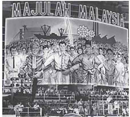
ภาพงานประกาศรวมสิงคโปร์เข้ากับมาเลเซีย ของนายกรัฐมนตรีลีควานยู ตามแผนของพรรค People's Action Party เมื่อ ค.ศ. 1959

การเลือกตั้งทั่วไปครั้งแรกของโครงการใหม่มีผู้มีสิทธิออกเสียงไปลงคะแนนเสียงเลือกตั้งมากกว่าร้อยละ 50 แต่ไม่มีพรรคใดเข้มแข็งพอจะจัดตั้งรัฐบาลได้ เดวิด มาเชลล์ หัวหน้าพรรคกรรมกรได้รวบรวมเสียงสนับสนุนด้วยความช่วยเหลือของผู้แทนสหพรรค UMNO และพรรค MCA จนได้เป็นนายกรัฐมนตรี แต่เขาก็มีงานที่ยากลำบากในความพยายามสมานพรรคไว้ด้วยกัน ในที่สุดเขาก็ลาออกใน ค.ศ. 1956 เนื่องจากไม่อาจยอมรับหลักการจัดความมั่นคงภายในที่รัฐบาลอังกฤษตอบสนองต่อข้อเรียกร้องที่เขาขอให้สิงคโปร์ปกครองตนเอง อย่างไรก็ตามลิมยิวฮ็อค ผู้รับตำแหน่งแทน ได้ทำข้อตกลงเกี่ยวกับปัญหาความมั่นคงในปีต่อมา สิงคโปร์จึงได้รัฐธรรมนูญฉบับหนึ่ง ครั้งนี้ให้อำนาจปกครองตนเองแก่สิงคโปร์อย่างสมบูรณ์ โดยมีตำแหน่งยังดี-เปอร์ตวนนคราของมลายูหรือประมุขของรัฐแทนตำแหน่งข้าหลวง มีการเลือกตั้งสมาชิกสภานิติบัญญัติ 51 คน ซึ่งจะรับผิดชอบร่วมกับสภาคณะรัฐมนตรี ทุกคนที่เกิดในสิงคโปร์จะได้สัญชาติโดยอัตโนมัติ คนอื่นอาจโอนสัญชาติหลังจากมาอยู่อาศัยระยะหนึ่ง มีการแก้ปัญหาเกี่ยวกับความมั่นคงโดยให้คณะกรรมการเพื่อความมั่นคงภายในรับผิดชอบ ประกอบด้วยนายกรัฐมนตรีและรัฐมนตรี 2 คน ข้าหลวงและผู้แทนอังกฤษ 2 คน และรัฐมนตรีของรัฐบาลมลายูอีก 1 คน การเลือกตั้งครั้งแรกจัดให้มีขึ้นในเดือนพฤษภาคม ค.ศ. 1959 และในช่วงเวลาที่ยังคั่นระหว่างวันที่ 2-3 มิถุนายน ค.ศ. 1959 ก็เกิดมีประเทศใหม่ขึ้นอย่างเป็นทางการ