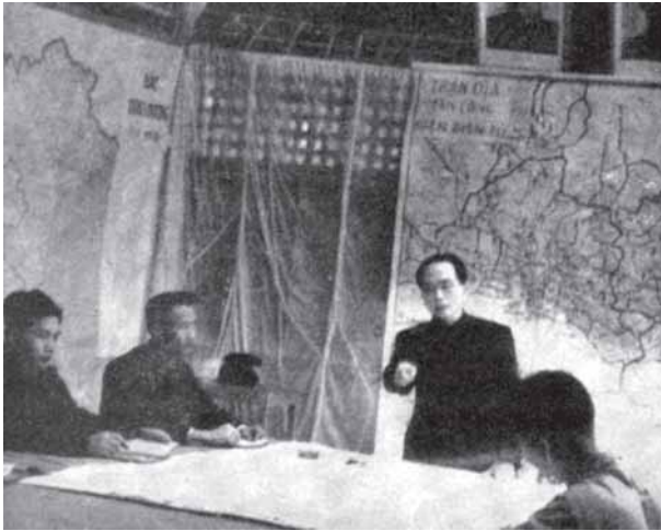
นายพลโวเหงียนเกียบ ผู้ได้รับแต่งตั้งจากประธานาธิบดีโฮจิมินห์ ให้บัญชาการทหารและการรบกับฝรั่งเศส และได้รับชัยชนะเด็ดขาดในสงครามเวียดนามฟู (เมืองแถน) เมื่อ 7 พฤษภาคม ค.ศ. 1954

ปัจจัยอื่นจากจีนจะรวดเร็วขึ้น ด้วยเหตุนี้ขณะที่ฝรั่งเศสกระจายกำลังออกไปตามจุดต่างๆ หลายร้อยจุด พวกเวียดนามก็สร้างกองทหารประจำการขึ้นพร้อมจะขยายการปฏิบัติงาน อย่างไรก็ตามช่วงระยะหนึ่ง การโจมตีของเวียดนามก็ถูกตีแตกกลับไป และในเดือนพฤศจิกายน ค.ศ. 1951 “เลอ รัว จอง” ก็ได้ใช้แผนการป้องกันใหม่ขึ้นแรกด้วยการเข้ายึดหัวบ่บั้นท์ บนฝั่งแม่น้ำดำ อันเป็นศูนย์กลางการคมนาคมที่สำคัญของเวียดนาม แต่ไม่ได้หมายความว่ามีการเปลี่ยนยุทธวิธีที่ต้องตกเป็นฝ่ายตั้งรับ อันทำให้ผู้คนจำนวนมากต้องถูกตรึงอยู่อย่างไร้สมรรถภาพ และละทิ้งพรมแดนจีนให้เป็นทางผ่านที่พวกเวียดนามจะได้รับความช่วยเหลืออย่างกว้างขวางในทันทีที่มีการเจรจาสงบศึกในสงครามเกาหลี ดังนั้นการตายชนิดที่ยังไม่ถึงเวลาอันควรของเดอลาทเทรอในสถานรักษาคนป่วยที่กรุงปารีส ในเดือนมกราคม ค.ศ. 1952 จึงมีผลกระทบต่อชะตากรรมของฝรั่งเศสในการสู้รบที่แคว้นตั้งเกี่ยวเพียงเล็กน้อย การถูกบังคับให้อพยพจากหัวบ่บั้นท์หลังจากนั้นไม่นาน อาจเกิดขึ้นอยู่แล้วไม่ว่ากรณีใด อีกทางหนึ่งเดอลาทเทรอก็ช่วยจัดตั้งกองทัพแห่งชาติเวียดนามซึ่งได้เริ่มเป็นรูปเป็นร่างบ้างแล้วก่อนที่จะมาถึง เพียงแต่ต้องการอุปกรณ์ต่างๆ อย่างเร่งด่วน ความช่วยเหลือสำหรับกองทัพที่เดอลาทเทรอได้รับเพิ่มขึ้นจากอูซิงตันนั้น มิได้เป็นงานเล็กที่สุดของเขาในการต่อต้านเวียดนาม การบีบบังคับจากกรุงวอชิงตันในระหว่าง ค.ศ. 1952 ทำให้มีกำลังทหารเข้าประจำในกองทัพแห่งชาติเพิ่มขึ้นอย่างรวดเร็ว แต่ไม่มีประสิทธิภาพ เพราะเป็นทหารที่เกณฑ์มา และได้รับการฝึกอย่างเร่งรีบไม่มีสมรรถภาพในการปฏิบัติการต่อต้านพวกเวียดนามในภาคใต้ และยังคงถูกใช้แบ่งเบาภาระทหารฝรั่งเศสในแคว้นตั้งเกี่ยวอีก