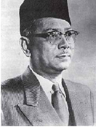
ตงกู อัปดุล ราห์มาน นายกรัฐมนตรีคนแรกของมาเลเซีย ผู้ได้รับการยกย่องว่าเป็น “บิดาแห่งเอกราช” หรือ “Bapa Merdeka” ทรงเป็นเชื้อสายในราชวงศ์เกตะห์ มีพระมารดาเป็นไทย

จัดทำเองคือ ใน ค.ศ. 1952 องค์การแห่งชาติมลายูและสมาคมชาวจีนในมลายูร่วมกันตั้ง “สหพรรค” เพื่อเข้าชิงชัยในการเลือกตั้งเทศบาลนครที่กัวลาลัมเปอร์ การประสบความสำเร็จเป็นกำลังใจให้สหพรรคมีจุดมุ่งหมายที่สูงขึ้นไป ใน ค.ศ. 1954 โดยการนำของตงกูอัปดุลราห์มาน โอรสสุลต่านแห่งรัฐไทรบุรี ซึ่งจบจากมหาวิทยาลัยเคมบริดจ์ และรับราชการเป็นเจ้าหน้าที่ท้องถิ่นในระบบราชการพลเรือนของมลายู