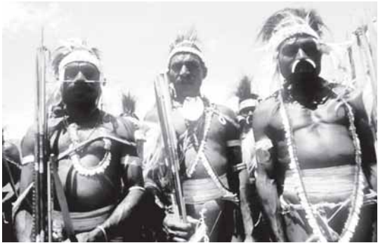
นิวกินี หรือปาปัวตะวันตก ซึ่งถูกฮอลันดาครอบครองต่อไปอีกหลังปี ค.ศ. 1949 ที่อินโดนีเซียหลุดออกจากอาณานิคมไป ซึ่งสหประชาชาติได้เข้าไปปกครองชั่วคราว และโอนให้อินโดนีเซียในปี ค.ศ. 1962 โดยเปลี่ยนชื่อเป็น อิริเยนจายา ที่มีเมืองทองคำและทองแดง ทั้งยังมีขบวนการเอกราชแบ่งแยกดินแดนอยู่