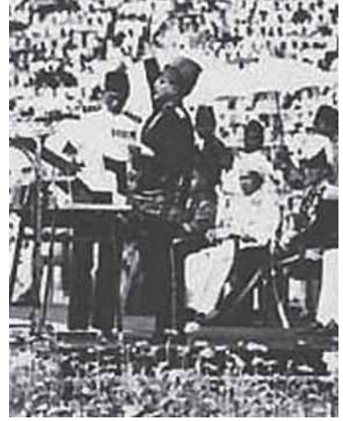
ตงกู อับดุล ราห์มาน ประกาศเอกราชมาเลเซีย ค.ศ. 1957

เมื่อมีผู้วิจารณ์คนหนึ่งตั้งคำถามขึ้นว่า เพราะเหตุใดมลายูจึงได้เอกราชอย่างรวดเร็ว 1 เขาเสนอว่าประสบการณ์ของอังกฤษในประเทศอินเดีย ปากีสถาน ลังกาและพม่า ทำให้อังกฤษเห็นแบบอย่าง และเป็นเครื่องกระตุ้น ความแข็งแกร่งและการรวมพลังของสหพรรคแสดงให้เห็นว่ามลายูสามารถแก้ ปัญหาของตนเองได้ดีที่สุด ยิ่งกว่านั้นปัจจัยด้านกำลังทหารแต่เพียงอย่างเดียวของอังกฤษ ก็ไม่สามารถปราบปรามการคุกคามของพวกคอมมิวนิสต์ได้ หากคาดคะเนว่าลัทธิชาตินิยมของมลายูจะเป็นอาวุธที่มีประสิทธิภาพยิ่งกว่า ถ้ายินยอมตอบสนองข้อเรียกร้องของลัทธิชาตินิยม ปัจจัยที่ไม่สำคัญนักแต่กลับ เป็นปัจจัยแท้จริงก็คือ ความเต็มใจของพวกสหพรรคที่จะให้มลายูยังคงอยู่ในจักรภพอังกฤษ และทำข้อตกลงเกี่ยวกับการป้องกันโดยอนุญาตให้อังกฤษยังคงมีฐานทัพบกอยู่ในมลายู รวมถึงการสำรองกำลัง ด้านยุทธศาสตร์ของจักรภพภายในประเทศ และอาจเพิ่มเหตุผลอีกข้อว่าบุคลิกของตงกูอับดุลราห์มาน ได้ก่อให้เกิดความเชื่อมั่นไว้วางใจอีกด้วย