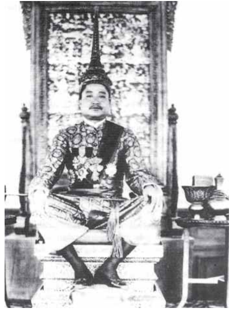
พระเจ้าศรีสว่างวงศ์

อาณาจักรลาวที่เราได้อ่านในบทก่อน 1 สูญเสียเอกลักษณ์ของประเทศมานาน ก่อนหน้าฝรั่งเศส จะเข้ามายึดในทศวรรษที่ 1890 เมืองเวียงจันทน์ซึ่งแยกจากหลวงพระบางใน ค.ศ. 1707 ถูกประเทศ ไทยครอบครอง และหลวงพระบางก็เป็นรัฐใต้อำนาจการปกครองที่ กรุงเทพฯ ฝรั่งเศสจัดให้หลวงพระบางเป็นรัฐอารักขาใน ค.ศ. 1893 และดำเนินการอ้างสิทธิ์ในดินแดนลาวภาคกลางและภาคใต้จากไทย ได้สำเร็จในเดือนเมษายน ค.ศ. 1945 ขณะที่ลาวอยู่ใต้การยึดครอง ของญี่ปุ่น พระเจ้าศรีสว่างวงศ์แห่งหลวงพระบางทรงประกาศเอกราช หลังจากญี่ปุ่นแพ้ ดินแดนของลาวถูกรวมเข้าด้วยกันตามข้อตกลง กับฝรั่งเศส และใช้ชื่อว่า ประเทศลาว (27 สิงหาคม ค.ศ. 1947) หลวงพระบางเป็นราชธานีที่ประทับของกษัตริย์ แต่เวียงจันทน์ซึ่งตั้ง อยู่ใจกลางประเทศมากกว่าหลวงพระบาง เป็นเมืองหลวงสำหรับการ ปกครอง ทั้ง 2 เมืองต่างก็เป็นเมืองเล็ก ชาวลาวอยู่กันเป็นหมู่บ้าน และหาเลี้ยงชีพด้วยการกสิกรรม ไม่มีเส้นทางรถไฟ ถนนหนทางอยู่ ในสภาพที่เลวมาก แม้แต่สิ่งอำนวยความสะดวกในการเดินเรือในลำ แม่น้ำโขงก็ไม่ดีนัก ลาวเป็นอาณาจักรที่ล้อมรอบด้วยแผ่นดิน ไม่มี โอกาสมีเมืองท่าอย่างไชน่ฮงและกรุงเทพฯ ที่จะช่วยให้มีการติดต่อ ค้าขายใดๆ กับต่างชาติ