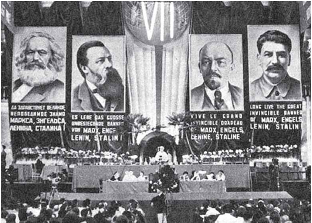
ที่ประชุม “โคมินเทิร์น” หรือคอมมิวนิสต์สากล ในเดือนพฤษภาคม ค.ศ. 1935 เป็นการประชุมครั้งที่ 7 และครั้งสุดท้าย ที่มีมติให้ฝ่ายคอมมิวนิสต์ร่วมมือกับชนชั้นกลางและชนชั้นที่มีใช้กรรมกร

ชาวเอเชียตะวันออกเฉียงใต้ไม่ต้องการถูกอินเดียนครอบงำ และสยบยอมแก่จีนน้อยลง ก่อนสงครามโลกครั้งที่ 2 จีนถูกกันออกไปจากเอเชียตะวันออกเฉียงใต้ โดยอาศัยการปกครองของชาวยุโรปเป็นเครื่องกำบัง จีนเองก็อ่อนแอและถูกญี่ปุ่นรบกวน อย่างไรก็ตามเมื่อเอเชียตะวันออกเฉียงใต้ได้เอกราชแล้ว ประเทศจีนใหม่ก็เข้ามาติดต่อ ใช้ประโยชน์จากชื่อเสียงในด้านนโยบายภายในที่ก้าวหน้า และดำเนินการค้าเพื่อสร้างความประทับใจแก่ชาวเอเชียตะวันออกเฉียงใต้ ในระยะแรกความรู้สึกเป็นปรปักษ์ต่อระบบอาณานิคมได้บดบังชาวเอเชียในการพิจารณาความตั้งใจของจีน แต่ใน ค.ศ. 1954 เมื่อนายกรัฐมนตรีโจวเอินไหลมาร่วมประชุมกับเนห์รู ได้ให้คำปฏิญาณที่จะรักษาหลักปรัชญาศีลของการอยู่ร่วมกัน และได้แสดงออกถึงความเป็นผู้มีเหตุผลลุ่มลุ่มและนุ่มนวล ณ ที่ประชุมเมืองบันดุงใน ค.ศ. 1955 กับทั้งขอร้องให้ชาวจีนฟื้นฟูทะเลปฏิบัติตามกฎหมายของประเทศที่เข้าไปอยู่อาศัย และให้หลีกเลี่ยงกิจกรรมทางการเมือง ทำให้ชาวเอเชียตะวันออกเฉียงใต้คลายความกังวลใจเกี่ยวกับนโยบายของจีนไปมาก