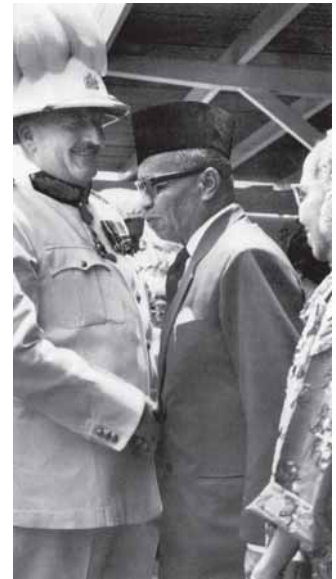
เซอร์อเล็กซานเดอร์ แวดเดลล์ ข้าหลวงใหญ่ของอังกฤษคนสุดท้าย กล่าวอำลาสิ้นสุดการปกครองของอังกฤษในซาราวัก ค.ศ. 1963

เมื่อวันที่ 31 กรกฎาคม ตนกูอัปดุลราห์มานและแมคมิลแลนลงนามในข้อตกลงให้โอนอำนาจการปกครองของอังกฤษในบอร์เนียวเหนือ ซาราวักและสิงคโปร์ ในวันที่ 31 สิงหาคม ค.ศ. 1963 ซึ่งมีผลให้เกิดสหพันธรัฐใหม่แห่งมาเลเซีย และตกลงกันด้วยว่าควรจัดตั้งคณะกรรมการระหว่างรัฐบาลภายใต้ความควบคุมของเอิร์ลแลนส์ดาวน์ เพื่อดำเนินงานจัดเตรียมรัฐธรรมนูญที่จำเป็นต่อการคุ้มครองผลประโยชน์พิเศษของรัฐบอร์เนียวทั้งหลาย ข้อเสนอเหล่านี้เกิดจากความแตกต่างอย่างมากระหว่างมาเลเซียตะวันออกและตะวันตกในด้านพัฒนาทางการเมืองและเศรษฐกิจ และด้านการศึกษา ที่สำคัญเช่น มหาวิทยาลัยและสถาบันศึกษาชั้นสูงทั้งหลาย รวมทั้งศูนย์ค้นคว้าวิจัยต่างๆ ล้วนอยู่ในเขตตะวันตกทั้งหมด นอกจากนี้รัฐต่างๆ ในบอร์เนียวยังคัดค้านการให้ศาสนาอิสลามเป็นศาสนาประจำชาติและการใช้ภาษามลายูเป็นภาษาราชการเพียงภาษาเดียว อีกทั้งเรียกร้องให้รับรองฐานะพิเศษของชนพื้นเมืองของบอร์เนียว เพื่อให้มีการป้องกันอย่างเพียงพอสำหรับการอพยพพลัดถิ่นเข้ามาในบอร์เนียว โดยเฉพาะชาวจีน