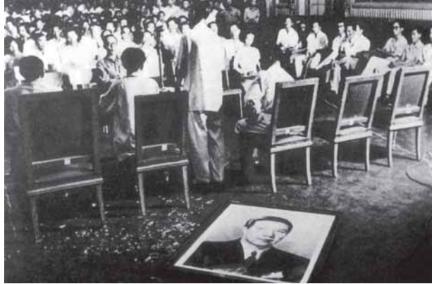
พระบรมฉายาลักษณ์ของจักรพรรดิเบ๋าได้ ถูกทำลายในที่ประชุมประชามติของชุมชนเวียดนามใต้ โดยโงดinhเดียม ประกาศยกเลิกระบบจักรพรรดิและประกาศแต่งตั้งตนเองเป็นประธานาธิบดีเวียดนามเมื่อวันที่ 26 ตุลาคม ค.ศ. 1955 ทั้งนี้เป็นการดำเนินการตามคำแนะนำของที่ปรึกษาชาวอเมริกัน

ข้อตกลงเงินว่าทำโดยข้ามหน้ารัฐบาลที่ไซ่ง่อนซึ่งคัดค้านการแบ่งประเทศอย่างเต็มที่ ด้วยเหตุนี้ทางไซ่ง่อนจึงสามารถหลีกเลี่ยงข้อความที่บ่งไว้ให้มีการเลือกตั้งทั่วไปในเดือนกรกฎาคม ค.ศ. 1956 การดำเนินงานเป็นขั้นๆ เพื่อปลดปล่อยเวียดนามใต้ให้พ้นจากการควบคุมของฝรั่งเศส ไม่อาจนำมากล่าวถึงได้อย่างละเอียดในที่นี้ รัฐบาลที่ไซ่ง่อนวางเงื่อนไขของการเปลี่ยนตำแหน่งข้าหลวงใหญ่ทั่วไปฝรั่งเศสเป็น “เอกอัครราชทูต” และยกเลิกข้อตกลงกับฝรั่งเศสว่าด้วยเงินตราและการคลัง เปลี่ยนเงินเปียสให้อยู่ในตระกูลเงินเหรียญ จัดการให้ถอนกำลังออกไปและเปิดช่องทางให้ความช่วยเหลือของอเมริกามาสู่ไซ่ง่อนโดยตรงแทนที่จะผ่านปารีส และท้ายที่สุดได้ยกเลิกอำนาจของจักรพรรดิเบ๋าได้ และประกาศตั้งสาธารณรัฐเวียดนามในวันที่ 26 ตุลาคม ค.ศ. 1955 ภายหลังการลงประชามติ ซึ่ง “ผลที่ออกมามันสุดท้ายเกินความคาดหมาย โดยคะแนนเสียงในบางแห่งมีเกินจำนวนของผู้มีสิทธิลงคะแนนเสียงในทะเบียนการเลือกตั้ง” 3